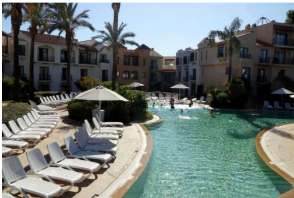
L'Hotel PortAventura, que forma part de la Vila Mediterrània.

- En prosperar el turisme és quan comença el problema, perquè hi havia gent que se n'anava a viure a Salou o emprenien els negocis a Salou. Ser independents és dominar l'urbanisme, és edificar 12 plantes o sis, i l'Ajuntament de Vila-seca era un tipus de gent que tenia molta terra, que eren pagesos molts d'ells i les coses se les miraven amb precaució. En arribar la democràcia, l'Ajuntament era socialista i Salou era convergent. Van animar una possible separació, es va tramitar, l'Ajuntament de Vila-seca ho va denegar i es va portar a la justícia: l'Audiència Provincial ho va tombar.