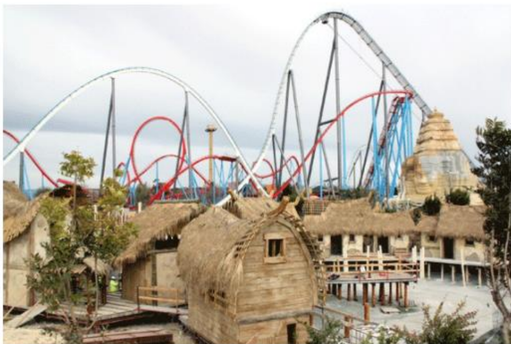
El parc temàtic de PortAventura, en una imatge d'arxiu.