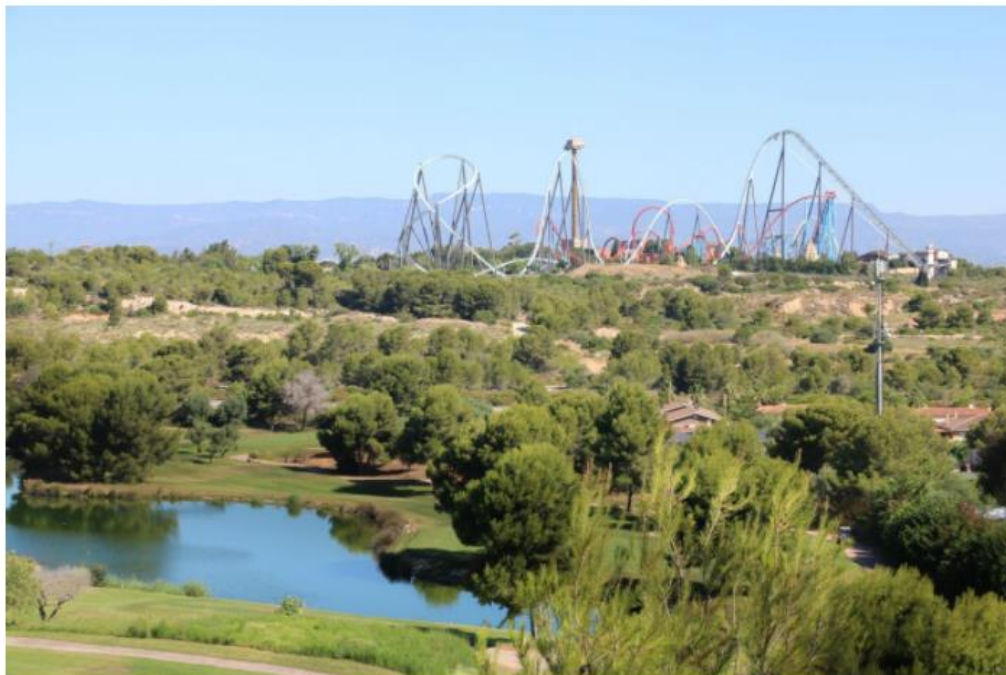
Els terrenys on s'ubicarà el macroprojecte del CRT

per Josep Maria Llauredó, Vila-seca/Salou, 1 de desembre de 2020 a les 06:17 | 📄