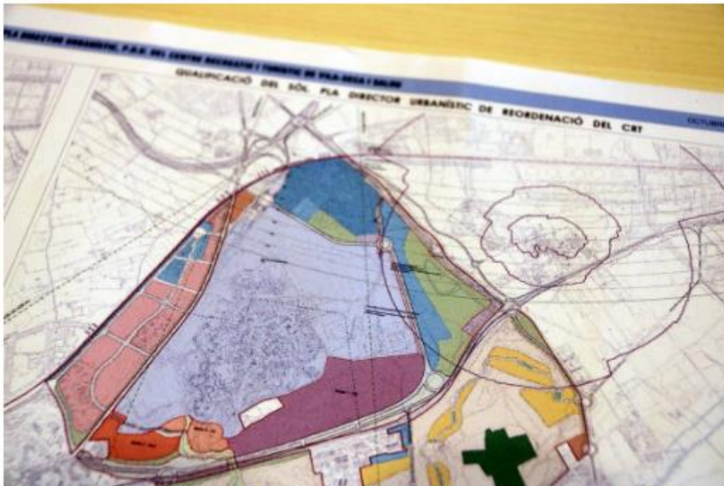
Plànol amb els usos del CRT de Vila-seca i Salou, amb una franja en vermell al centre on es preveu el complex de Hard Rock, i els sectors d'espais verds -en verd- i d'equipaments -en blau- a la dreta, tombats pel TSJC.