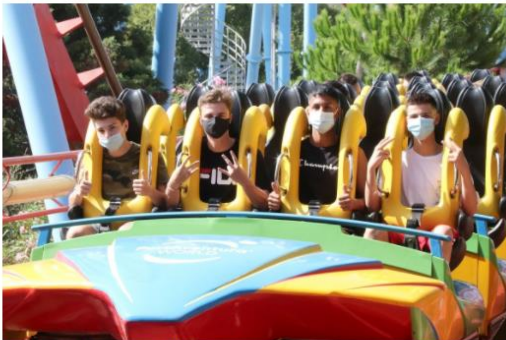
PortAventura estrena la nova normalitat.

- Perquè a nivell de la política o de l'economia, quan una cosa va bé i està de moda a l'estranger sempre es vol. Hi ha molts països que no tenen fàbrica de cotxes i que ho busquen, per exemple en el cas del Marroc a través de compensacions. Formava part també de l'esperit Pujol: Catalunya serà important.